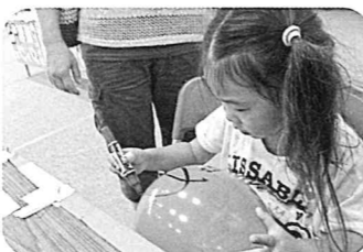
風船に夢を書こう!!