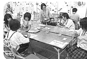
ビー玉ストラップ作り