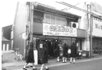
兵庫県立山崎高校「山高街の駅」

最後にまごの店以外に全国で3つの高校生レストランができたそうですが、2つはすでに閉店したとのこと。ポイントは高校生の意識の持ち方、周りの大人も我慢強く継続的に支援できるかだと思いました。