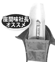
座間味社長 オススメ 立てて使える ペンケース