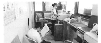
ジョブシャドウイング