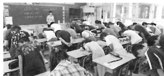
事前学習②マナー学習