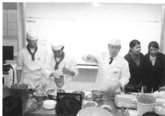
三重県立相可高校食物調理