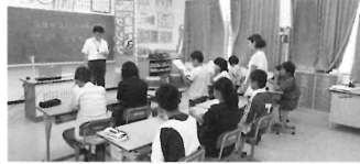
事前学習①仕事とは？

働く大人をじっくり観察することで、働くことや仕事について考える機会をつくります。 どんな仕事をしているのか？ どんな風に働いているのか？ どんな職場なのか？ 皆さん自分の目で見て感じて下さい。