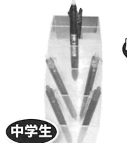
中学生 消えるボールペン フリクション