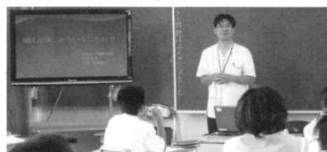
事前学習③企業人講話