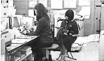
(株) エアー沖縄 名護店