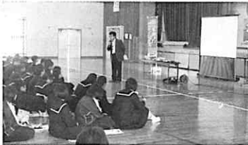
ジョブシャドウイングとは?