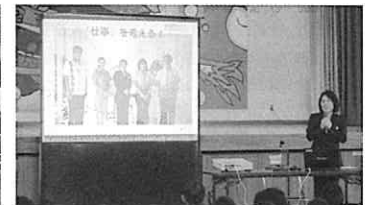
城間さんの講話風景