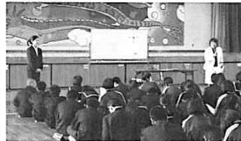
宇久田さんのマナー講習