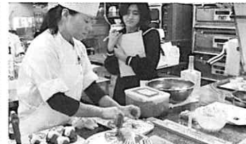
パティスリーボンシャンス!