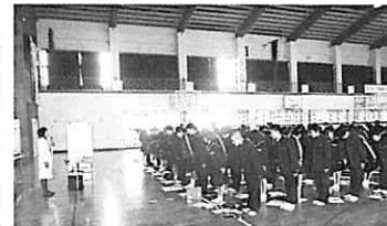
あいさつとお辞儀の練習