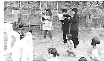
子育て広場 ぴっぴ