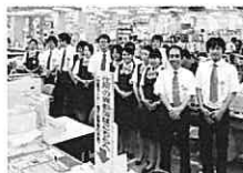
名護市役所受付窓口

〒905-0018 名護市大東4丁目16-23 101号室 TEL 0980-52-5705