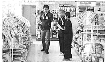
ファミリーマート(名護大南4丁目店)